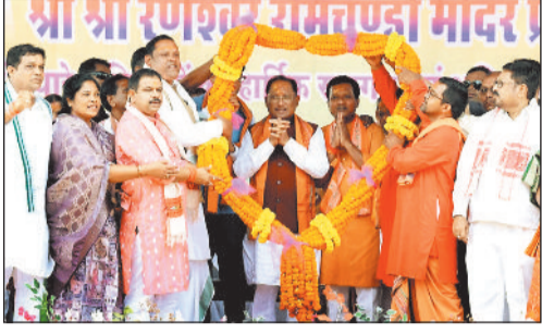
मुख्यमंत्री विष्णुदेव साय का सम्मान करते नागरिक।

मुख्यमंत्री श्री साय ने श्री श्री रणेश्वर रामचण्डी मंदिर की प्राण प्रतिष्ठा के अवसर पर माता रामचण्डी के चरणों में पूजा-अर्चना कर प्रदेशवासियों की सुख-समृद्धि और खुशहाली की कामना की। उन्होंने कहा कि आज झगरपुर की इस पावन भूमि पर आकर आत्मिक शांति का अनुभव हो रहा है। यह मंदिर न केवल श्रद्धा का प्रतीक है, बल्कि हमारे समाज की सांस्कृतिक चेतना और एकता का भी संदेश देता है। मुख्यमंत्री ने कहा कि भारत की आत्मा उसकी संस्कृति और परंपराओं में बसती है। जहाँ नारी का सम्मान होता है, वहाँ ईश्वर का वास होता है। उन्होंने माता-पिता को सच्चा ईश्वर बताते हुए कहा कि यदि माता-पिता प्रसन्न हैं तो सभी देवी-देवता प्रसन्न रहते हैं। उन्होंने सभी से अपने घर के बड़ों के प्रति सम्मान और सेवा भाव बनाए रखने का आग्रह किया।